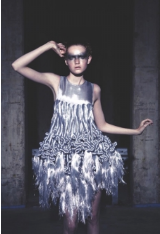
Iris van Herpen